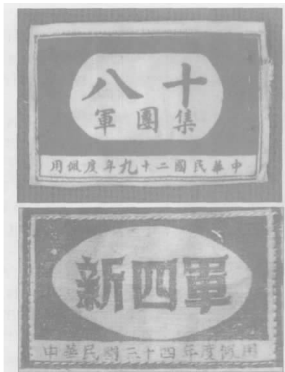
八路军臂章、新四军臂章

皖南事变后,我党从抗战大局出发,豁达大度,仍保持了与国民党的统战关系,新四军也继续佩戴国民革命军帽徽。但由于国民党不再发军服,而新四军部队不断发展壮大,于是新四军部队逐步不戴帽徽。另外,皖南事变后,国民党当局也停止了对八路军的各种供应。但因为当时八路军还被国民党当局