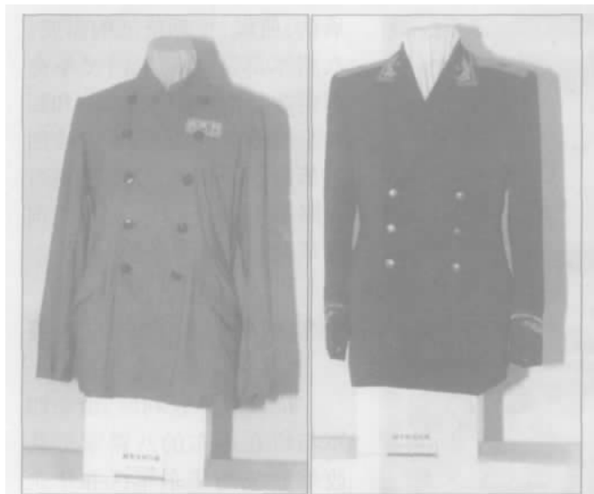
50式陆军女列宁服上衣