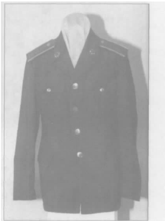
87式陆军学员夏常服

新式夏常服由过去的 3 型系列改为 5 型系列,面料由的确良改为“多重多异复合化纤长丝织物”,外观、质感与毛料无异,保暖性、防风性、透气性都达到毛料的指标,而且有很好的抗皱保型性,抗静电,可水洗,易干,耐磨。样式与 87 式常服相同,但服装版型有一定改进,腰身比较明显。